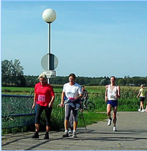
Schnelle Halbmarathonis laufen auf die Walker auf