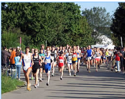
Start für 10km und Halbmarathon