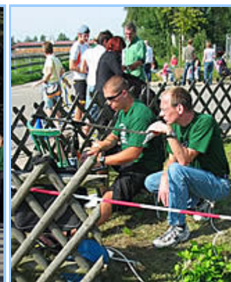
Die Ansager vom Dienst